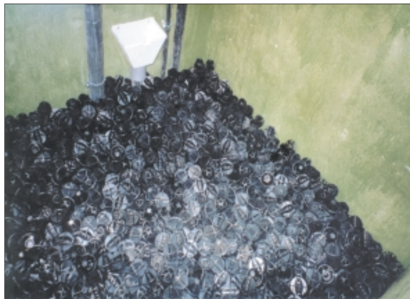
Figura 3 – Vista della griglia di aerazione e del materiale di supporto, SAB ® /D R (ECOACQUE ® , 2002).

SAB ® /DR, sono assai interessanti per quelle località turistiche e/o per quelle "aree sensibili", sia costiere, sia montane che di rilevanza paesaggistica (località turistiche), nelle quali si hanno: